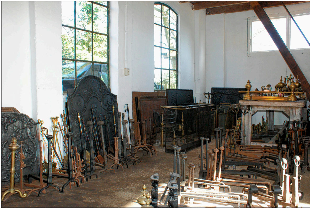
Haardplaten te kust en te keur in Amerongen. www.antieke-haardplaat.nl .

15de eeuw in gebruik. Ze werden geplaatst tegen de stenen achterwand van de stookplaatsen in kastelen en buitenhuizen; later ook in particuliere woningen. Meestal zijn het gietijzeren platen, gegoten volgens de zogenaamde 'zandgietmethode'. Aanvankelijk kon men alleen eenvoudige platen gieten en was variatie alleen mogelijk in het formaat. Ingewikkelde voorstelling met bepaalde beeltenissen en/of symbolische voorstellingen op de plaat volgden in de 16de en 17de eeuw.